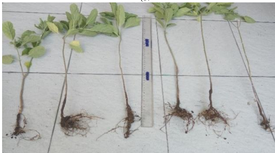
Gambar 2. Panjang Akar Tanaman Keji Beling Umur 8 Minggu