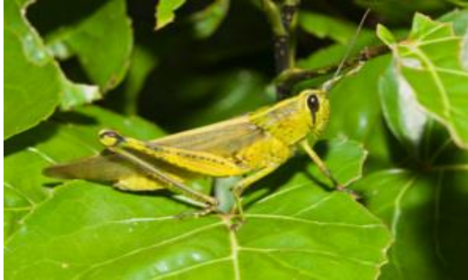
Gambar 2. Belalang kembara

perjalanan. Perilaku makan belalang kembara dewasa biasanya diwaktu hinggap pada sore hari sampai malam dan pada pagi hari sebelum terbang. Belalang ini cenderung memilih makanan yang lebih disukainya, terutama spesies tumbuhan dari Famili Graminae (Kasholven, 1981) dalam (Hamim, et al., 2005).