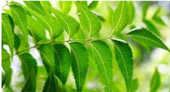
Gambar 1. Daun Mimba ( Azadirachta indica A.Juss)

Daun mimba mengandung bahan aktif azadiraktin ( C_{35}H_{44}O_{16} ), salanin, meliantriol dan nimbin. Azadiraktin mengandung sekitar 17 komponen sehingga sulit untuk menentukan jenis komponen yang paling berperan sebagai pestisida. Kematian hama akibat dari penggunaan mimba terjadi pada pergantian instar instar berikutnya atau pada proses metamorfosis. Mimba tidak membunuh hama secara cepat, tetapi berpengaruh terhadap hama pada daya makan, pertumbuhan, daya reproduksi, proses ganti kulit, hambatan pembentukan serangga dewasa, menghambat perkawinan, menghambat pembentukan kitin dan komunikasi seksual (Nurtiati, et al.,) dalam (Ardiansyah, et al., 2002).