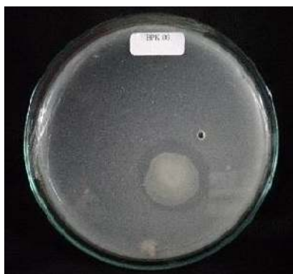
Gambar 1. Bakteri Pelarut Kalium pada Aleksandrov agar

melarutkan kalium baik secara kualitatif maupun secara kuantitatif. Secara kualitatif, kemampuan BPK dalam melarutkan kalium dinilai dari Indeks Pelarutan (IP). Indeks pelarutan merupakan perbandingan antara diameter zona bening dengan diameter koloni BPK. Sehingga semakin tinggi pertumbuhan BPK atau semakin besar BPK maka nilai IP akan semakin kecil. Sebaliknya semakin panjang diameter zona bening yang dihasilkan maka semakin besar nilai IP. Tabel 2 menunjukkan bahwa isola J2-2 memiliki IP paling tinggi (3,99) dibandingkan dengan isolat lainnya, padahal diameter zona beningnya bukan yang terbesar, yakni 3,22. Hal tersebut menunjukkan bahwa diameter koloni BPK isolat J2-2 sangat kecil. Isolat L1-1 memiliki IP yang tergolong kecil yakni 1,06. Disisi lain zona bening dari isolat L1-1 lebih tinggi dibanding J2-2, yakni 5,88. Hasil IP isolat L1-1 menunjukkan bahwa diameter koloni isolat J2-2 lebih besar dibanding koloni isolat L1-1.