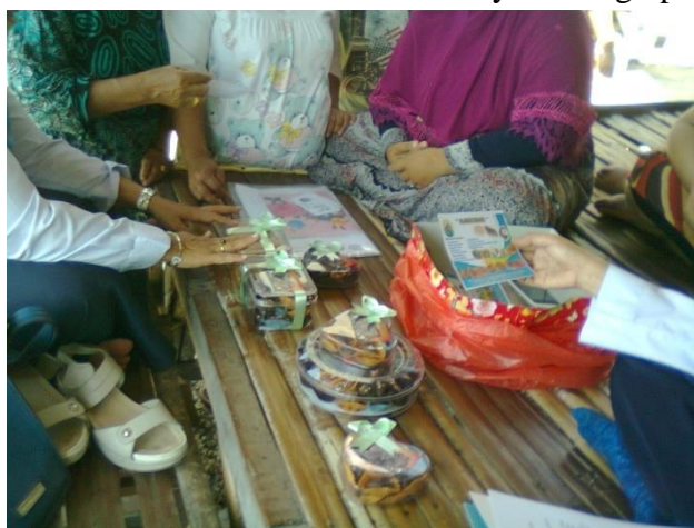
Gambar 4. Hasil olahan yang dijadikan souvenir hajat.

Temuan peneliti bahwa sebelum menggunakan peralatan mixer tersebut, maka pengolahan kerang dilakukan secara tradisional dengan mengaduk bahan menggunakan tangan sehingga hasilnya kurang optimal (kurang halus).