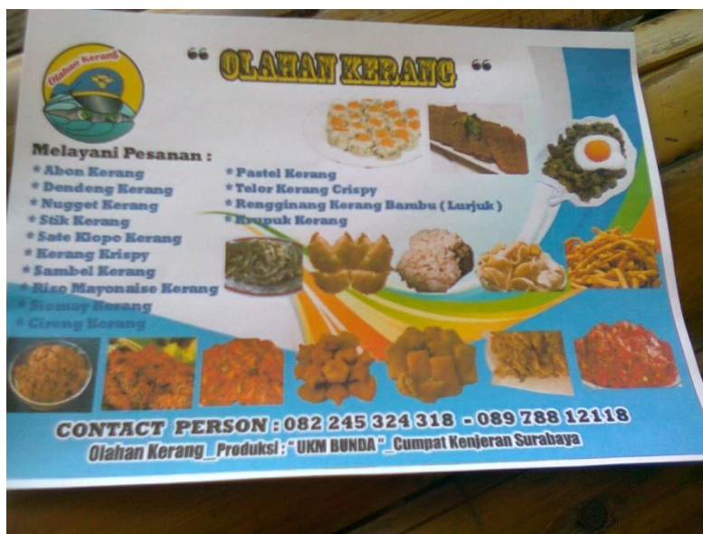
Gambar 2. Produk olahan kerang.

Dalam memproduksi produk olahan kerang tersebut menggunakan Mesin Mixer Roti untuk percepatan produksi dan mutu adonan yang lebih baik, karena selain akan menghemat waktu dalam meratakan adonan tentu saja mengaduk adonan kue dengan tangan sendiri akan sangat melelahkan dan memakan waktu yang lebih lama. Dengan adanya mesin Mixer Roti memiliki kemampuan mencampur yang lebih baik karena Mesin Mixer Roti bisa memutar pengaduk dengan tingkat putaran per menit yang tinggi. Mixer ini dilengkapi dengan pengaduk spiral untuk mengaduk adonan roti, kue, atau mi, pengaduk jenis beater untuk mengaduk adonan croissant dan pastry,