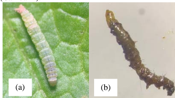
Gambar 1. Morfologi P. xylostella (a) P. xylostella tanpa aplikasi, (b) P. xylostella yang mati akibat perlakuan ekstrak daun sirih.

P. xylostella yang mati akibat perlakuan yang telah dilakukan memiliki perbedaan terhadap ciri fisik larva yang tanpa perlakuan (kontrol). Hasil pengamatan terlihat jelas bahwa terdapat perubahan tingkah laku dan warna larva. Perubahan tingkah laku ditandai dengan gerakan larva P. xylostella yang kurang aktif (melambat). Perubahan warna P. xylostella dari hijau dengan bintik hitam di bagian abdomennya menjadi hijau yang mendekati abu-abu, kemudian warna tubuhnya menjadi hitam dan menyebabkan kematian (Gambar 2).