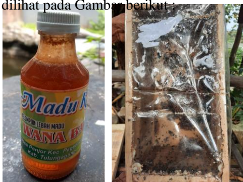
Gambar 1. Produk Madu dan Stup Koloni

Selain madu, terdapat 3 peternak yang menjual produk berupa stup kayu dan koloni. Belum terdapat produk turunan dari lebah madu klanceng di Kecamatan Pagerwojo. Lebah madu klanceng juga memiliki potensi produk turunan. Bee polen dapat menjadi produk turunan dari usaha budidaya lebah madu klanceng (Wibawanti, Mudawaroch, & Pamungkas, 2020). Produk lebah madu klanceng dapat dilihat pada Gambar berikut: