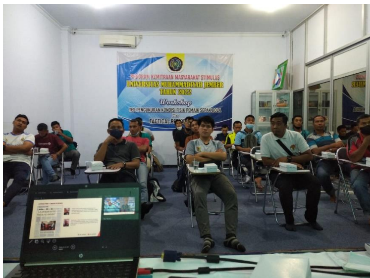
Gambar 1: Peserta menyimak pemaparan materi