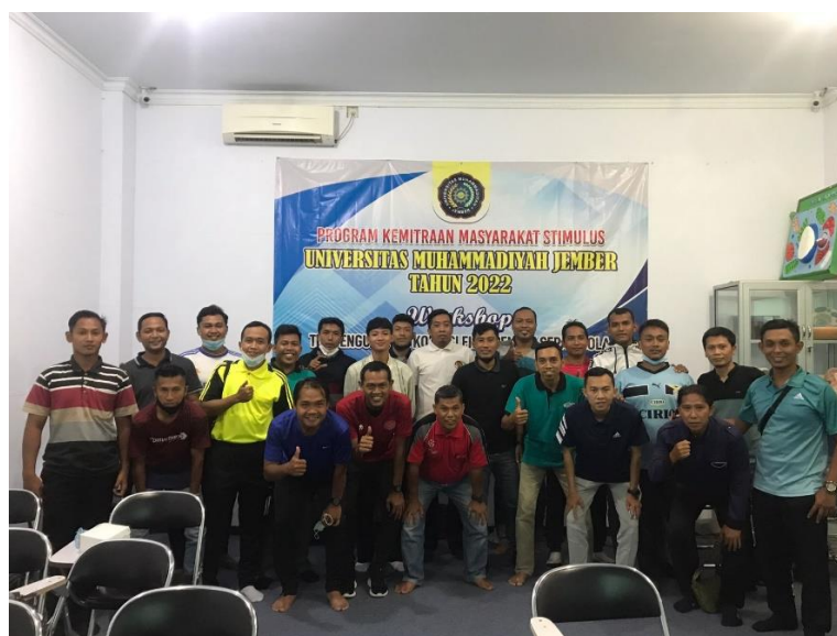
Gambar 2: Foto bersama setelah kegiatan