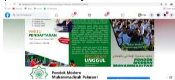
Gambar 1. Halaman depan laman PMMP

Sebagai data awal, Pondok Modern Muhammadiyah Pakusari (selanjutnya disebut PMMP) Jember juga mengembangkan sistem informasi digital melalui penggunaan laman. Laman yang dimiliki oleh PMMP adalah https://pmmpakusari.ponpes.id/ . Melalui laman tersebut, PMMP memberikan informasi yang mudah diakses masyarakat. Berikut tampilan laman PMMP.