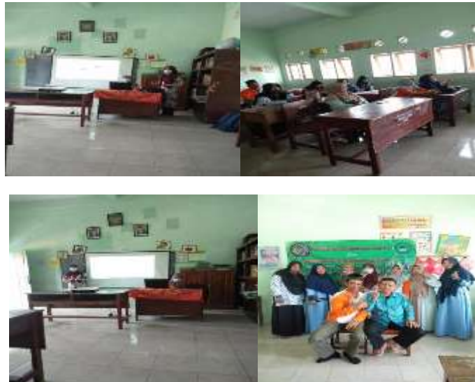
Foto-Foto Proses Pelaksanaan Pengabdian

Setelah diberikan sosialisasi tentang model pembelajaran mind mapping didapatkan bahwa sepuluh guru memahami tentang mind mapping . Hal ini dapat terlihat dari cara mereka menyampaikan konsep penggunaan Mind Mapping yang sesuai dengan konteks mata pelajaran yang mereka ajarkan pada kelas masing-masing. Selain itu, pemahaman guru juga dapat terlihat ketika guru mencoba membuat contoh mind mappingnya sendiri sesuai dengan contoh yang sudah diberikan oleh pelaksana dalam pemaparan materi. Berikut foto-foto pelaksanaan pengabdian pada masyarakat.